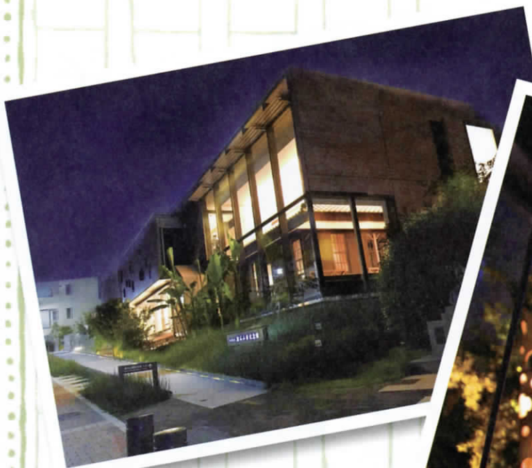
漱石山房記念館外観