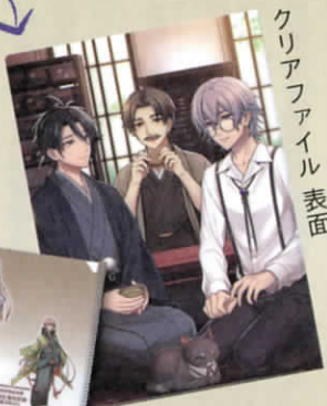
クリアファイル 表面