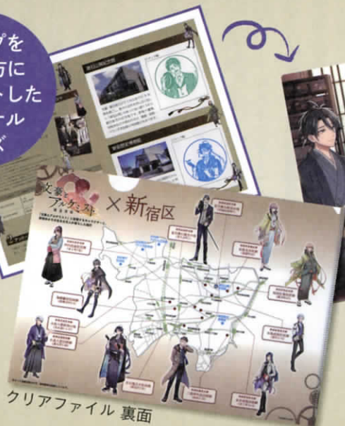
クリアファイル 裏面